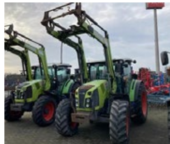
CLAAS ARION 420 | 34071 Bj. 2016, 8.544h, FL 80C, 3. Steuerkreis, Multikuppler, 3 DW, Dachluke, Ber.: 440/65R28+540/65R38