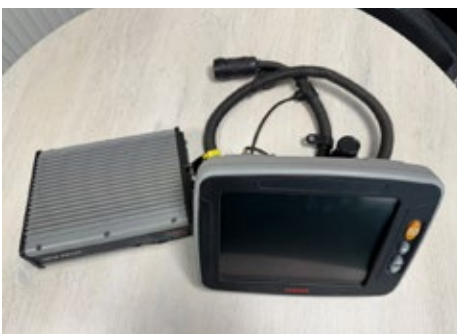
CLAAS Lenksystem RTK mit S 10 Terminal | 30159 Bj. 2018, CLAAS Lenksystem RTK mit S 10 Terminal, GPS Pilot, TSM Modul, Empfänger Antenne