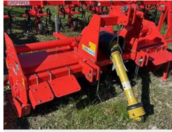
Maschio U 180 | 31075 Bj. 2024, 6 Winkelmesser pro Flansch, Gleitkufen, 1,80 m Arbeitsbreite 6.900,00 €