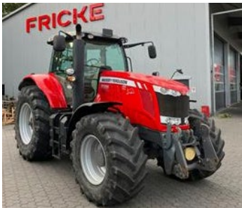
Massey Ferguson 7726 | 32284 Bj. 2018, 5.015h, FKH, FZW, 1 DW vo., 5 DW hi., Isobus, Load Sensing, K80, Ber.: 600/65R28+710/70R38