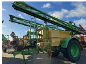
Dammann ANP 4027 | 29247 Bj. 1998, 27m Gestänge, 2-fach Düsen- stock, hydr. Deichsellenkung, Distance Control