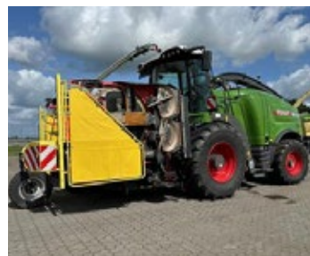
Fendt Katana 650 Allrad | 32664 Bj. 2023, 285h, Umkehrlüfter, Novatel, 28 Messertrommel, R Corn Cracker Krümmerverl., 40 km/h, Kemper 460 Plus, Stalk Buster, Kemper PU 3003 Max