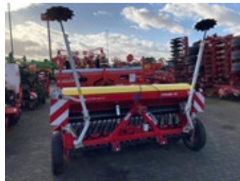
Pöttinger Vitsem 302 | 33281 Bj. 2021, 25 Scheibenschare, Exakt Striegel, Spuranzeiger, Fahrwassenschaltung 14.870,00 €