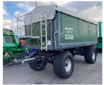
Conow HW 180 | 24370 Bj. 2023, hydr. Bordwand li., Pendelrückbordwand, Kornauslauf, Ber.: 560/45R22.5