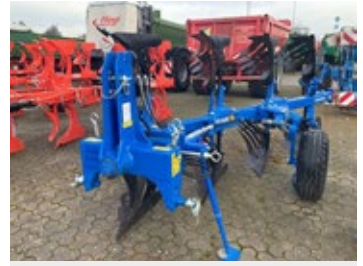
Rabe Albatros 120M | 24479 Bj. 2023, neuwertig, 4 Schare, Scheibensech, Pendelstützrad 17.900,00 €