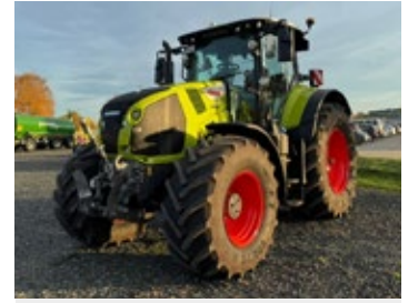
CLAAS AXION 810 | 30013 Bj. 2025, 580h, 50km/h, 5x + 1x DW, ZW 540ECO + 1000/1000ECO, Load Sensing, ISOBUS, 50km/h, gef. VA, LED-ABS, CEMIS 1200 RTK Lenksystem, Ber.: 600/70 R30 + 710/70 R42