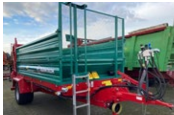
Farmtech Superfex 700 | 34250 Bj. 2025, Aufaufbremse, einstellb. Kratzbodengeschw., 4 Streuwalzen, hydr. Heckklappe