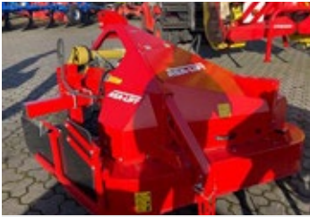
Asa-Lift OT-1500F | 31135 Bj. 2021, hydr. Arbeitstiefenverst., aut. Reihenfindung, 1,50m Arbeitsbreite