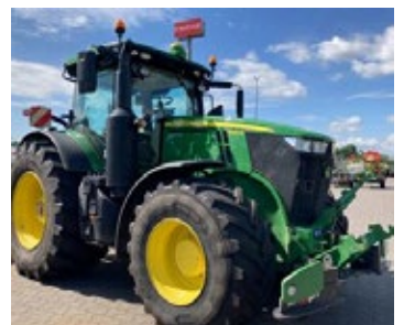
John Deere 7290R | 32326 Bj. 2020, 4.678h, FKH, Rammenschutz, 5 DW, Load Sensing, ISOBUS, K80, Steckachse, E23 Getr., SF 3000 Empf., Ber.: 620/75R30+900/60R42