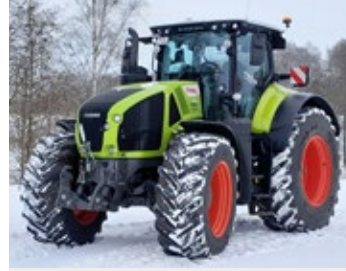
CLAAS AXION 930 | 30031 Bj. 2025, 680h, FKH, CEBIS Terminal, hydr. Oberlenker, 50 km/h, ZW 1000 + 1000E U/min, LED Premium, ELECTROPILOT mit Reversierfunktion, CEMIS 1200 RTK Lenksystem, Ber.: 650/60R38+750/70R44