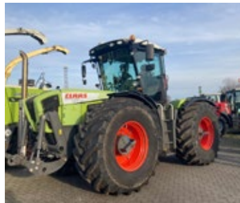
CLAAS XERION 3800 VC | 27362 Bj. 2009, 11.272h, Front+Heckhydraulik, 5 DW, 50 km/h, Druckluftbremsanlage 1+2 Kreis, Ber.: 800/70R38