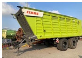
CLAAS CARGOS 750 | 32573 Bj. 2020, 2 Dosierwalzen, Laderaumab- deckung, Knickdeichsel, Arbeitsschein- werfer, K80 unten