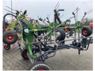
Fendt Twister 11008 T | 27477 Bj. 2022, 8 Kreisel á 6 Arme, Warntafeln, Beleuchtung 16.900,00 €