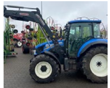
New Holland T 4.95 | 32989 Bj. 2016, 8.025h, Dreipkt. Heckhubwerk, 4 DW, Überbreitenausrüstung, Lastschaltgetriebe