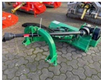
Geo AGL 125 | 29287 Bj. 2021, hydr. Seiten- & Neigungsverstellung, Hammerschlegel, Stützwalze 1.250,00 €