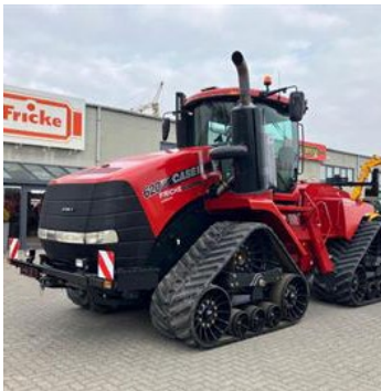
Case Quad Trac 620 | 32989 Bj. 2016, 8.025h, Dreipkt. Heckhubwerk, 4 DW, Überbreitenausrüstung, Lastschaltgetriebe