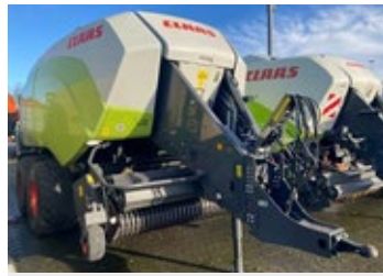
CLAAS QUADRANT 5300 FC | 30627 Bj. 2020, 15.116 Ballen, 2.35m PU, FC Schneidrotor 51 Messer, Ballenaus- stoßer, K80 unten, Tandemlenkache