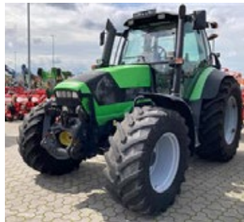
Deutz M 620 | 32298 Bj. 2012, 7.028h, FKH, FZW, gef. Vorderachse, 4 DW, K80 fest, Load Sensing, Ber.: 540/65R28+650/65R38