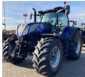
New Holland T 7300 | 31999 Bj. 2023, 1.655h, K80 fest, 5 DW, Load Sensing, Isobus, hydr. Oberlenker, Ber.: 600/70R30+710/70R42