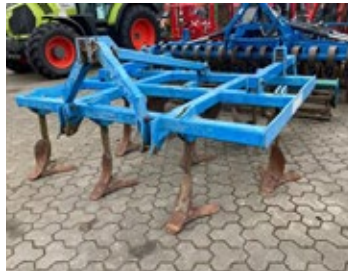
Saphir FG 260 | 32650 Bj. 2000, 2,60 m Arbeitsbreite, Eine- bungsscheiben, Rohrstabwalze 990,00 €