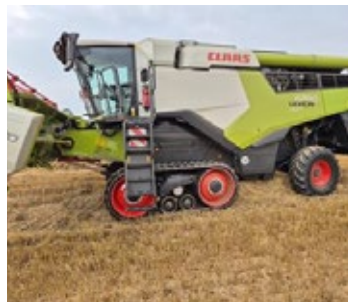
CLAAS LEXION 6700 TT | 33277 Bj. 2025, 125h, Arbeitsbeleuchtung LED, Triebachse XL, Auto Contour, 3D Staubabsaugung, Lenkachse M, Vario 770 Schneidwerk m. Rapsmesser