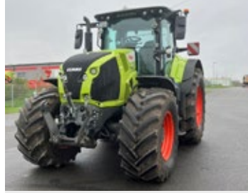
CLAAS AXION 870 | 26400 Bj. 2024, 2.050 Std., FKH, ISOBUS, Load Sensing, ELECTROPILOT, gef. Vorderachse, LED Premium, 5x + 1x DW, hydr. Obelenker, CEMIS 1200 RTK Lenksystem, Hydraulikpumpe 205l/min, Ber.: 600/70R30 + 710/70R42