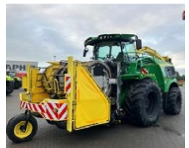
John Deere 9800 | 33442 Bj. 2020, 2.025h, Corn Cracker, aut. Zentralschmierung, hydr. Klappb. Turmverl., Kemper 490plus, Auto Contour, Lenkaut., Ber.: 900/60R42+710/60R30