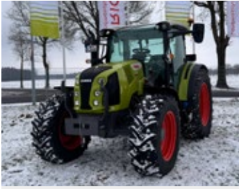
CLAAS ARION 420 CIS | 30078 Bj. 2025, 175h., Frontgewichtsträger, Frontladeranbaukonsole, Multifunktionsgriff FLEXPLOTT, Druckluftbremsanlage, 3x DW, LS, 40km/h, Panoramic Kabine, CIS-Bedienterminal, Ber.: 440/65R28+480/70R38