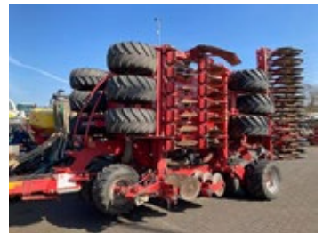
Kverneland U-Drill 6000 | 31348 Bj. 2015, Gummiandruckrollen, Exakt Striegel, 2 Dosierer, Düngerbefüll- schnecke 44.800,00 €