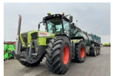
CLAAS XERION 3300 m. Güllewagen | 30273 Bj. 2006, 9.475h, K80 unten, 50km/h, Load Sensing, Ber.: 800/70R38 mit Kaweco Schwannenhals 30000, Bj. 2011, Schleppschuh Multi 18m, Ansaugarm oben