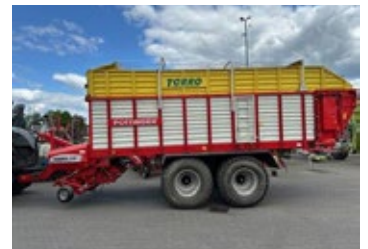
Pöttinger Torro 5700 D | 31464 Bj. 2012, breite Pickup, Ber.: 710/50-26.5, Lenkache, Schneidrotor 39 Messer