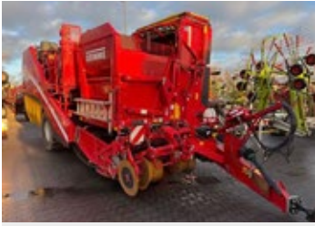
Grimme EVO 280 Clod Sep UB | 34227 Bj. 2021, K80 unten, hydr. Deichsellenkung, Steinsicherung, aut. Dammmittefindung, Neigungsverstellung, Speedtronic-Sep