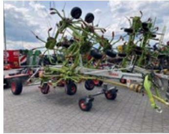
CLAAS Volto 1300T | 29308 Bj. 2020, 10 Kreisel á 7 Arme, hydr. Fahrwerk, Stützräder vo. 19.900,00 €