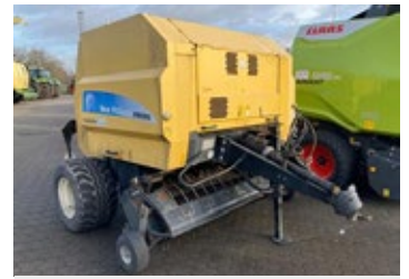
New Holland BR 9060 CropCutter | 34083 Bj. 2011, Zugösen Anhängung unten, mechanischer Stützfuß, Ber.: 480/45-17