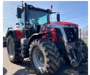
Massey Ferguson 85265 | 30947 Bj. 2022, 2.345h, FKH, gef. Vorderachse, schwenkb. Kotflügel vorn, 4 DW, K80 fest, Load Sensing, 50km/h, Ber.: 540/65 R30+650/65R42