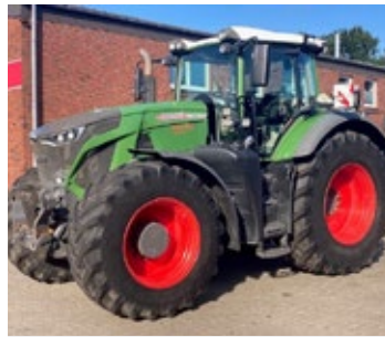
Fendt 942 | 32402 Bj. 2020, 4.270h, FKH, FZW, hydr. Anschl. Vorn, 5 DW, Load Sensing, 60km/h, Ber.: 560/65R34+710/75R42