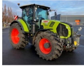
CLAAS ARION 660 CMATIC CEBIS | 29785 Bj. 2025, 1.100h, FHK, FZW, 4x DW, ISOBUS, K80, hydr. Oberlenker, 50km/h, Load Sensing, gef. Vorderachse, CEMIS 1200 RTK Lenksystem, Ber.: 600/60 R30 VF+710/60 R42 VF