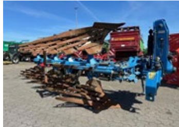
Rabe Super Albatros 140 | 30205 Bj. 2017, 5 Schare, hydr. Steinsicherung, Rahmenschwenzylinder, mech. Arbeitsbreitenverstel. 15.900,00 €