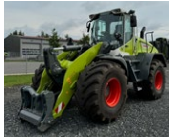
CLAAS TORION 1611P | 34727 Bj. 2025, 530h, 40km/h, Z-Kinematik, Multifunktionsgriff, Klimaautomatik, 3. Zusatzsteuerkreis, Zentralschmierung Z-Kinematik, Wiegeeinrichtung, LED-ABS, Ber.: 750/65 R26