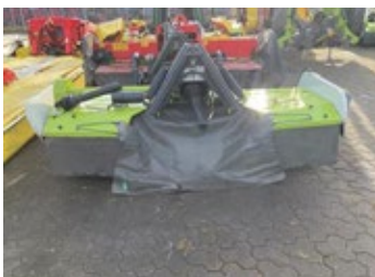
CLAAS CORTO 310F | 33501 Bj. 2024, Messerschnellwechsel, 4 Mähtrömmeln, 2 Schwadscheiben, 2 Entlastungsfedern 12.600,00 €