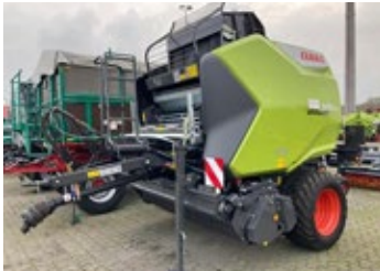
CLAAS VARIANT 585 RC Pro | 24784 Bj. 2023, 3.633 Ballen, Zugösenobenanh., 17 Messer, Netzbindung, Rollennieder- halter, Ber.: 500/45-22.5