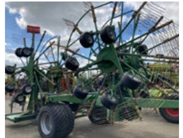
Krone Swadro 1370 TC | 31610 Bj. 2019, Isobus, Tasträder vo., 6-Rad Fahrwerk, Schwadentuch, elektr. Kreiselhöhenverst. 39.900,00 €