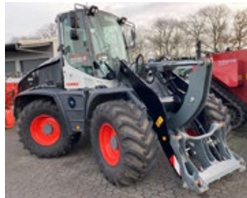
CLAAS TORION 956 Sinus | 32091 Bj. 2024, 317h, Werkzeugträger für Z-Kinematik hydr., 40 km/h, reversierbares Kühlergebläse, Heckkamera, LED, Schwingungsdämpfung, ZSA Z-Kinematik, Schaufelrückführungsautomatik, Ber.: 540/70R24