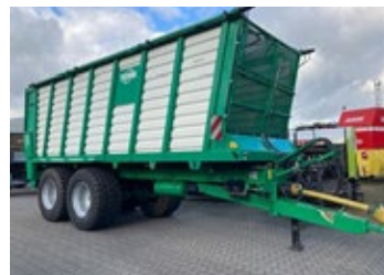
Tebbe ST500 Tandem | 31633 Bj. 2025, Lenkache, Dosierwalzen, An- häckselklappe, K80 unten, hydr. Lade- raumabdeckung, Ber.: 710/50R30.5