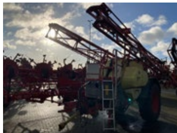
Rau Spridotrain | 32156 Bj. 2001, Deichsellenkung, 27 m Gestän- ge, Einfachdüsenstock, hydr. Hangaus- gleich, Verstellachse 4.800,00 €