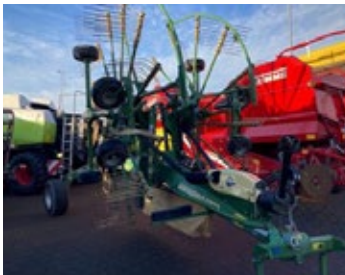
Krone Swadro TC 880 | 33973 Bj. 2021, 2 Kreisel á 13 Arme, mech. Kreiselhöhenverst., Schwadentuch 22.500,00 €