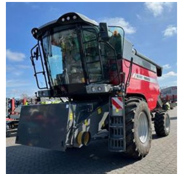
Massey Ferguson Activa 7344 | 30983 Bj. 2022, 25h, Verlustanz., Spreuverteiler, 20 km/h, 4,80m Schneidwerk 16FF, lange Halmteiler, Schnellkuppler, Ber.: 650/75R32+460/70R24