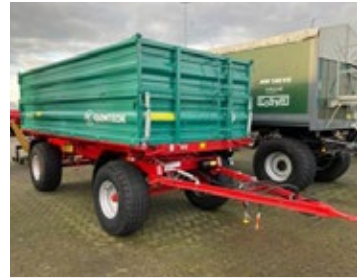
Farmtech ZDK 1100 | 34248 Bj. 2025, Kornschieber hi., Bordwandklappen, Zentralverriegelung, Ber.: 15.0/70-18