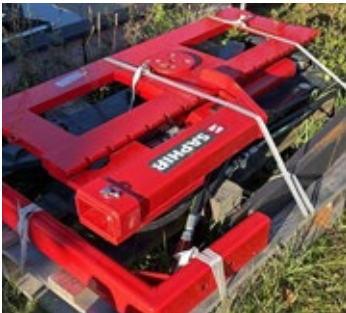
Saphir KDG 11/15 | 32265 Bj. 2025, Euro Schnellwechselfaufnahme, Drehrichtung Fahrtr. li. 220°