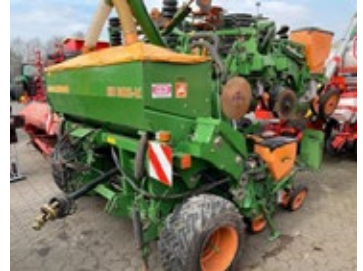
Amazone ED 602K | 30383 Bj. 2012, 8 rhg, hydr. Düngerbefüllschn., Scheibensähschare, hydr. klappbar 12.490,00 €