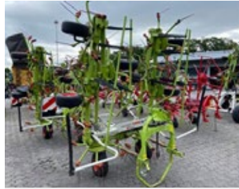
CLAAS Volto 900 | 29074 Bj. 2022, 9m Arbeitsbreite, hydr. klappbar, 102 gefederte Sterne 7.950,00 €