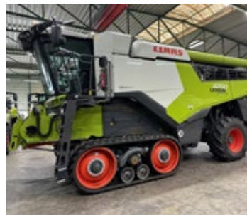
CLAAS LEXION 8700 TT | 34348 Bj. 2022, 823h, Vario 1080 Schneidwerk, Rapsausrüstung, Laserpilot II., Proficam m. Bildschirm, Cemos, Ber.: 735mm TT+620/70R30