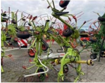
CLAAS Volto 800 | 28265 Bj. 2019, 6 Kreisel á 7 Arme, Warntafeln, Beleuchtung 7.900,00 €