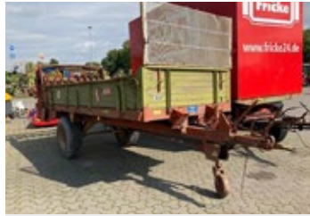
Bergmann M9 | 28922 Bj. 1984, Holzboardwände, Holzboden, 2 Streuwalzen, Ber.: 12.5/80-18