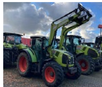
CLAAS ARION 440 PANORAMIC CIS | 31500 Bj. 2016, 10.533h, Frontlader 3. Kreis, Multikuppler, 3 DW hinten, Druckluft- bremse Ber.: 440/65/R28+600/65R38