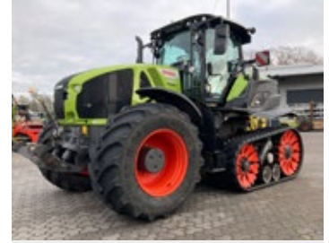
CLAAS AXION 960 Terra Trac | 28745 Bj. 2022, 2.355h, FKH, hydr. Oberlenker, K80, 5x + 2x DW, ZW 1000/1000ECO U/min, CEBIS Terminal, LED-Paket Premium, ISOBUS, Trimble GFX 750 RTK Lenksystem, Ber.: 710/60R34+TT Blw. 735mm