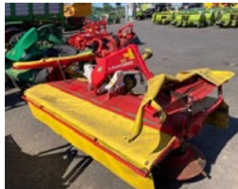
Pöttinger Eurocat 316 CI | 31431 Bj. 2010, 4 Mähtrömmeln, 2 Entlastungsfedern, Messerschnellwechsel 1.990,00 €