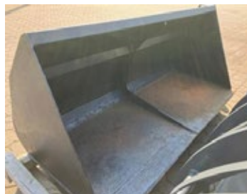
Schaufel 2,2m | 28300 Schäffer Aufnahme, 2,20 m Arbeitsbreite