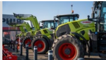
Gebrauchtmaschinen & Saphir