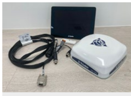
Trimble GFX 750 + NAV 900 RTK Lenksystem | 22786 Bj. 2022, Trimble GFX 750 Terminal, NAV 900 RTK Empfänger, Verkabelung, Terminalhalterung, Freischaltungen: RTK GPS Lenkung CANISOBUS UT