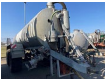
Kotte Garant VT 16200 | 31487 Bj. 2002, Ber.: 650/55R26.5+ 700/50R26.5, Zugösenobenanhangung, Suganschl. 6" vo. li. + re., 1x6" hinten, Lenkache