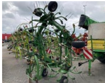
Krone KW 770 6x7 | 32172 Bj. 2005, 6 Kreisel á 7 Arme, hydr. klappbar, Warntafeln 3.900,00 €