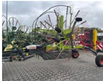
CLAAS Liner 2800 Trend | 30939 Bj. 2022, Schwadentuch, mech. Kreiselhöhenverst., 4-Rad Fahrwerk, Einzelaushub hydr. 20.900,00 €