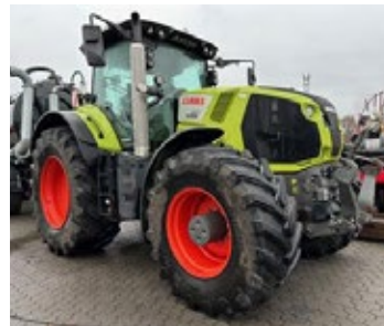
CLAAS AXION 870 | 28532 Bj. 2020, 4.974h, FKH, gef. Vorderachse, hydr. Oberlenker, K80, 4 DW, Cebis Touch, Ber.: 600/70R30+710/70R42