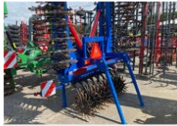
GST Denmark Biostar 900 | 29055 Bj. 2022, 9 m, hydr. klappbar, Warntafeln, Beleuchtung, 102 gefederte Sterne 17.900,00 €