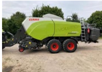
CLAAS QUADRANT 5300 Evolution | 24940 Bj. 2023, 1.456 Ballen, Isobus, Fine Cut Schneidrotor, K80 unten, Wiegeeinrich- tung Ballenausstoßer, Ber.: 620/50R22.5