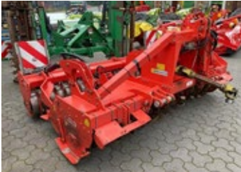
Maschio Unico M Passo | 27797 Bj. 2024, 5 Schare, Steinsicherung m. Abscherschraube, Schnittbreitenver- stellung 21.400,00 €