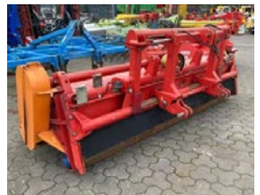
Dücker UM 30 FV | 29842 Bj. 2017, Hammerschlegel, hydr. Seitenverschiebung, Stützwalze 4.900,00 €