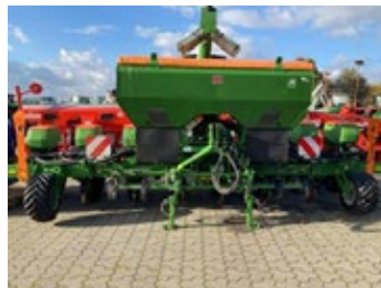
Amazone Precea 6000 | 30435 Bj. 2021, 8 rhg, Furchenräumer, Dünger- schnecke, Gummiandruckrollen 53.550,00 €