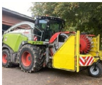
CLAAS JAGUAR 950 | 33654 Bj. 2021, 1.472h, V-Max 28 Trommel, Shredlage Cracker, Auto Fill, Kemper 460 Plus, Pendelrahmen, Multispeed-getriebe