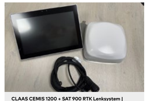
CLAAS CEMIS 1200 + SAT 900 RTK Lenksystem | 30872 Bj. 2023, CEMIS 1200 Terminal, SAT 900 RTK Empfänger, Section-Control, TC-GEO, VRA (variable Ausbringung)