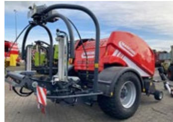
Maschio Mondiale 120 Combi | 33220 -Neumaschine- Bj. 2023, 15 Messer, hydr. Bremse, Zugösenuntenanh., Rol- lenniederhalter, Ballenaufsteller