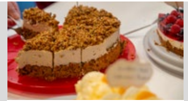
Torten von den Landfrauen