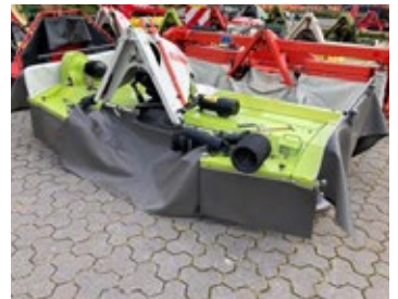
CLAAS CORTO 3200 F Profil | 24295 Bj. 2023, 4 Mähtrömmeln, 2 Entlastungsfedern, 2 Schwadscheiben 11.900,00 €