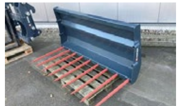
Saphir DG 17 EURO | 28302 Bj. 2024, Euroaufnahme