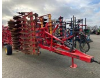
Väderstad Carrier 425 XL | 34072 Bj. 2016, K80 unten, hydr. Tiefenver- stellung, hydr. Fahrwerk 26.850,00 €