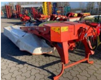
Kuhn GMD 3510 FF | 30456 Bj. 2015, 8 Mähscheiben, Anfahrerschutz, hydr. klappbar 4.900,00 €