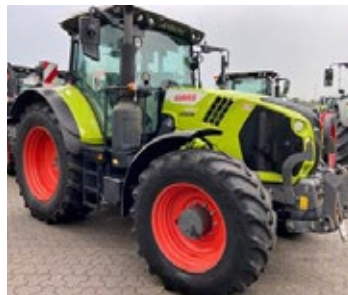
CLAAS ARION 650 | 28190 Bj. 2020, 4.315h, FKH, FZW, 4 DW, K80, 50 km/h, 24/24 Hexashiftgetriebe, Ber.: 540/65R30+650/65R42