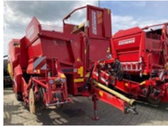
Grimme SE 75-22 NB | 29351 Bj. 2023, Kamerasystem, Eigenhydraulik, Dammaufnahme, aut. Dammmittefindung, Deichsellenkung