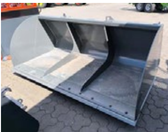
Bressel und Lade 2.50m LGS | 30633 Bj. 2024, SCORPION / Kramer KT Teletlader, geschr. Schürfleiste