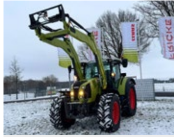
CLAAS ARION 470 CIS | 33625 Bj. 2025, 367h., FKH, FZW, Drehzahl-speicher, GPS Ready, LS, 3x DW, 40 km/h, ZW 540/540 ECO + 1000 U/min, LED Arbeitsscheinwerfer Ber.: 480/65R28+600/65R38