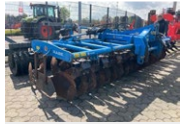
Rabe Sunbird 5000 | 27132 Bj. 2018, 5m Arbeitsbreite, hydr. klapp- bar, hydr. Walzenverst., Gummipacker- walze 14.870,00 €