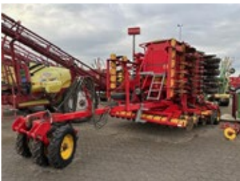
Väderstad Rapid RDA 600D | 33491 Bj. 2013, Zwischenreifenpacker, Spu- ranreisser, Striegel, Scheibenschare, Tankerhöhung 35.400,00 €