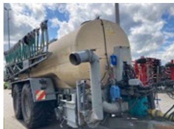
Eisele FW 240/185 | 31684 Bj. 2011, Schleppschuh 15m, Luftfahr- werk, Zwangslenkung, Andockarm re., K80 Untenanhangung Ber.: 750/60R30.5