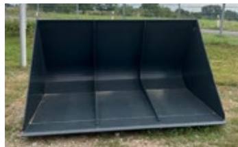
Saphir LGR 26.1 VLS | 28576 Bj. 2024, 2,60m Arbeitsbreite, VLS und Volvoaufnahme