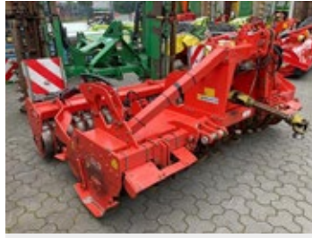
Maschio G 275 | 31926 Bj. 2020, Zahnpackerwalze, hydr. Walzenverst., 6 Messer je Flansch 11.300,00 €