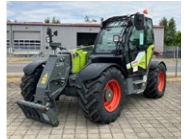
CLAAS SCORPION 756 | 24799 Bj. 2023, 759h, Klimaanlage, autom. Zentralschmierung, 3. Steuerkreis, 1x DW, hydr. Geräteverriegelung, 40 km/h, Rundumleuchte, Arbeitsscheinwerfer, Ber.: 460/70 R24