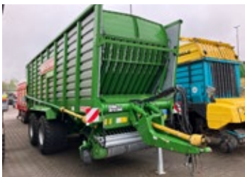
Bergmann Carex 410S | 31700 Bj. 2023, K80 unten, Knickdeichsel, An- häckselklappe, Tasträder, Load Sensing, Lenkache, 3 Dosierwalzen