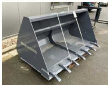
Kock + Sohn T-M 2000 | 30388 Bj. 2024, CLAAS TORION 535 Aufnahme, Schotterzähne