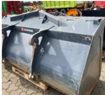
Saphir SGR 28.1 | 32223 Bj. 2020, 2,80 m Arbeitsbreite, TORION / Liebherr Aufnahme