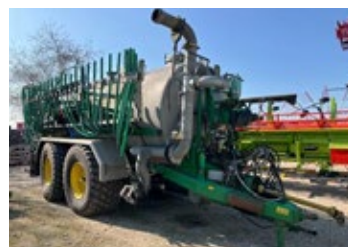
Meyer-Lohne PW 18000T | 29594 Bj. 2004, Anschl. vo. re. + li., Cutter li., Luftfahrwerk, Lenkache, 40km/h, 18m Schleppschlauchgestänge