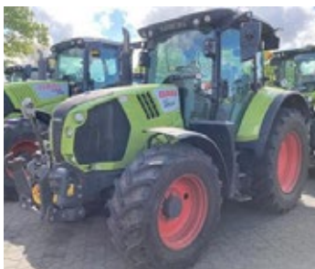
CLAAS ARION 510 | 31557 Bj. 2018, 4.115h, FKH, FZW, 3 DW, Glasdachluke, schwenkb. Kotflügel vorn, Klimaanlage, Ber.: 480/65R28+600/65R38