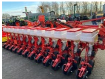
Maschio Manta IST 12 | 34251 Bj. 2023, 12 rhg, Isotronic, hydr. Geblä- antrieb, hydr. Spuranzeiger, Doppel- scheibenschare 58.300,00 €