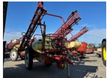
Hardi Commander | 32608 Bj. 1999, 21 m Gestänge, 3-fach Düsenstock, 5 Teilbreiten 16.660,00 €