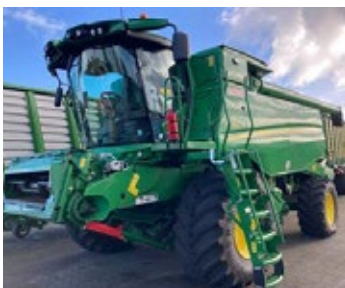
John Deere T 670 Allrad | 33579 Bj. 2023, 652h, Strohhäcksler, Spreuverteiler, 25 km/h, GPS Ready, 725X Schneidwerk, 2 mech. Rapsseitenmesser, Ber.: 900/60R32+600/65R28

Diese und viele weitere Maschinen finden Sie in unserem GEBRAUCHTMASCHINEN-ZENTRUM DIREKT AN DER A1