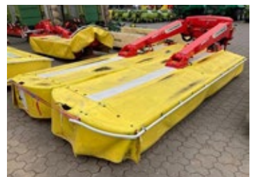
Pöttinger Novacat S 12 | 30425 Bj. 2018, Einzelaushub, 2x10 Mähscheiben, Mittenaufhängung, hydr. klappb. Schutztücher 19.900,00 €