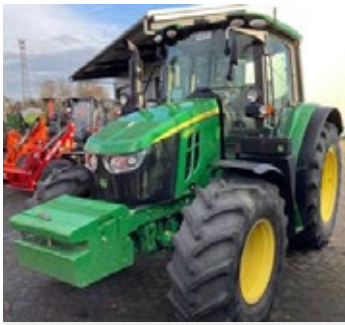
John Deere 6120 M | 34400 Bj. 2021, 1.128h, Frontgewichte, schwenkb. Kotflügel vorn, 3 DW, aut. AHK, 40 km/h, Isobus, Ber.: 480/70R24+520/70R38