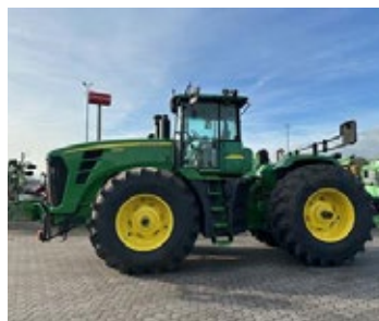
John Deere 9630 | 34360 Bj. 2008, 12.877h, Heckhydraulik, Druckluftbremse 2 Kreis, 4 DW, Radgew., Doppelräder, SF 3000, Zugpendel, Ber.: 800/70R38