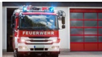
Feuerwehr Action Park