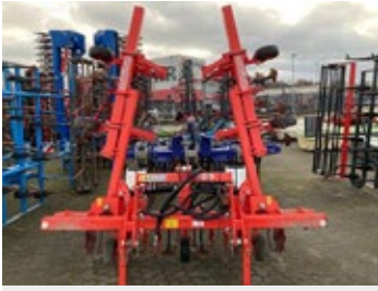
Maschio HS 6 | 31181 Bj. 2023, neuwertig, 6-rhg., 5 Federzinken/reihe, Gummistrad 9.340,00 €