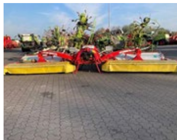
Pöttinger Novacat A 10 ED | 31904 Bj. 2017, Load Sensing, 2x8 Mähscheiben, Stahlzinkenaufbereiter 26.900,00 €