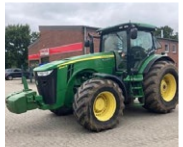
John Deere 8335R | 32405 Bj. 2014, 5.630h, gef. Vorderachse, 5 DW, Steckachse, Command Center Terminal, Ber.: 600/70R30+800/70R38