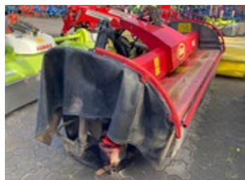
Vican Extra 332 | 33145 Bj. 2013, gezogener Anbaubock, 2 Entlastungsfedern, 8 Mähscheiben, 2 Schwadscheiben 2.950,00 €