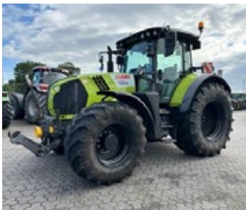
CLAAS ARION 660 | 31644 Bj. 2019, 7.198h, FKH, FZW, S10 Terminal, hydr. Oberlenker, K80, gef. Vorderachse, 50 km/h, Ber.: 710/70R38+600/65R28