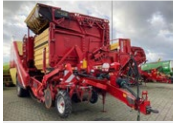
Grimme EVO 260 NonStop UB | 30733 Bj. 2022, Bunkerkettenölung, Furchendackel, Steinbunker m. Ablaufband, Kistenfülltuch, weicher Igel, Nonstop Bunker