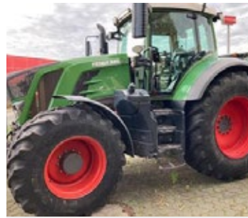
Fendt 826 | 33229 Bj. 2017, 10.565h, 2 DW vo., 4 DW hi., FKH, FZW, K80, Isobus, Load Sensing, Ber.: 600/70R30+710/70R42