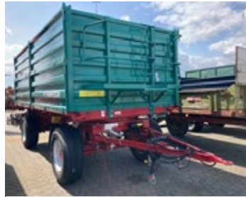
Farmtech ZDK 1800 | 32320 Bj. 2024, Kornschieber, Auslaufrutsche hi., Druckluftdurchtrieb, aut. AHK hi., Ber.: 385/65R22.5