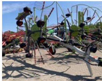
CLAAS Liner 1750 Twin | 29858 Bj. 2012, 2x 14 Zinkenarme, Schwadentuch, 6-Rad Fahrwerk, Warntafeln, Beleuchtung 10.900,00 €