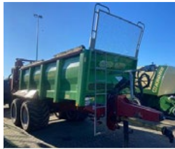
Strautmann VS 1604 Streublitz | 30421 Bj. 2015, 4 Streuwalzen, Schmierleiste, hydr. Streuerksschutz, Kratzboden, Ber.: 710/40-22.5