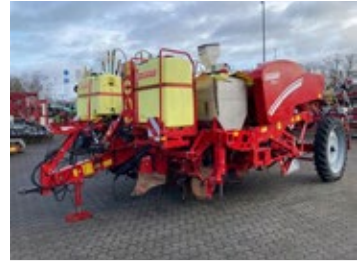
Grimme GB 430 | 33208 Bj. 2022, hydr. Einzelreihenantrieb, Kippbunker aut., Reihenweite 80-100-80, hydr. Rüttler