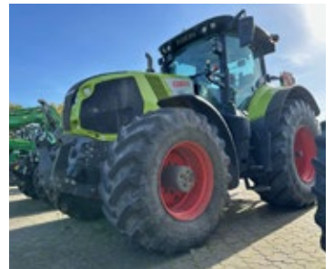
CLAAS AXION 870 | 29986 Bj. 2018, 7.083h, FKH, gef. Vorderachse, 4 DW, K80 unten + 1x K50, GPS Ready, Ber.: 600/70R30