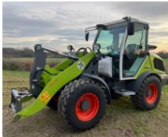
CLAAS TORION 530 | 31921 Bj. 2025, 150h, Hydr. Werkzeugträger, Hubgerüst, Druckloser Rücklauf front, 20km/h, Radio, LED Arbeitsbeleuchtung, Ber. 400/70R20