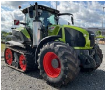
CLAAS AXION 960 TT | 32523 Bj. 2021, 2.980h, Cebis Touch, 5 DW, LS Hydraulik, FKH, Cemis 1200, Heckzapfwelle, Ber.: TT735 + 710/75R34