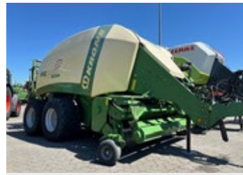
Krone Big Pack 1270 XC | 32502 Bj. 2014, 41.070 Ballen, 2.35m PU, Tandemlenkache, Ballenausstoßer, aut. Zentralschmierung