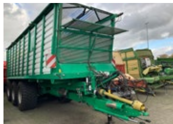
Tebbe ST650 Tridem | 32185 Bj. 2025, K80 unten, hydr. Fahrwerk, Zwangslenkung, hydr. Laderaumabde- ckung, hydr. Anhäckselklappe