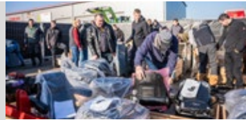
Schnäppchen in der Fundgrube