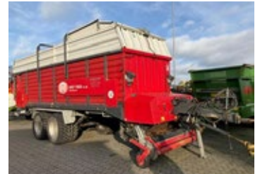
Lely Tigo 60 RD | 34070 Bj. 2015, Zugösenobenanh., Druckluft- bremse, Lenkache, 2 Dosierwalzen, Rollenniederhalter