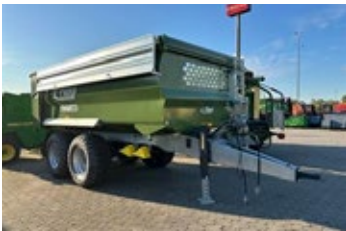
Fliegl TMK 140 FOX | 33446 Bj. 2024, 20cbm, 2-Kreis Druckluftbremse, verzinkter Silageaufsatz, Getreideschieber, 40km/h, Ber.: 550/45-22.5