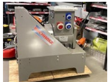
Buchholz Zapwellengenerator BU-ZG20 | 25877 Bj. 2023, AVR Regler, CEE Steckdose