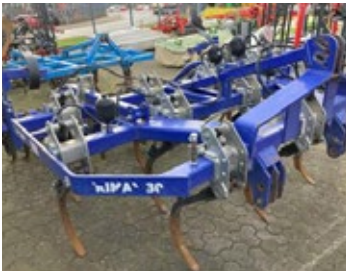
Dalbo Kultiwator Trimax | 34081 Bj. 2023, 10 Zinken, hydr. Steinsicher., gezackte Scheiben, Dachringwalze 10.990,00 €