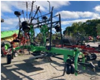
Deutz Fahr Swatmaster 7642 | 32730 Bj. 2013, 2 Kreisel á 11 Arme, Schwadentuch, 4-Rad Fahrwerk, mech. Kreiselhöhenverst. 9.900,00 €