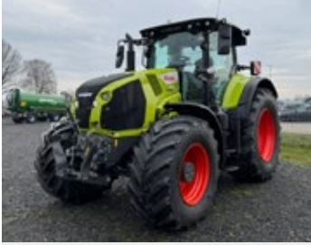
CLAAS AXION 830 | 29788 Bj. 2025, 1.015h, FZW, FKH, 5x + 1x DW, ISOBUS, K80 mit 2x K50, hydr. Oberlenker, Heckkamera, 50km/h, ISOBUS, Load Sensing, CEMIS 1200 RTK Lenksystem, Ber.: 600/70R30+710/70R42