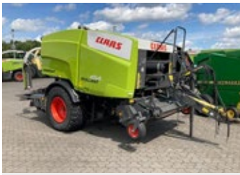
CLAAS ROLLANT 454 RC Uniwrap | 32344 Bj. 2014, 29.000 Ballen, K80 unten, Doppelrollenniederh., 24 Messer, 2-Arm Wickler