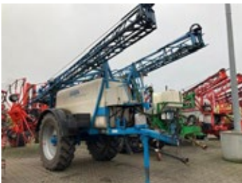
Inuma Professional 5030 | 29347 Bj. 2008, hydr. Höhenverstellung, hydr. Hangausgleich, Einspülschleuse 9.900,00 €