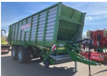
Bergmann Shuttle 450S | 31701 Bj. 2023, K80 unten, Knickdeichsel, Load Sensing, Schneidrotor 53 Messer, Lenkache, hydr. Fahrwerk