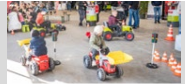
Kindervelt mit Hüpfburg, Kinderschminken & mehr